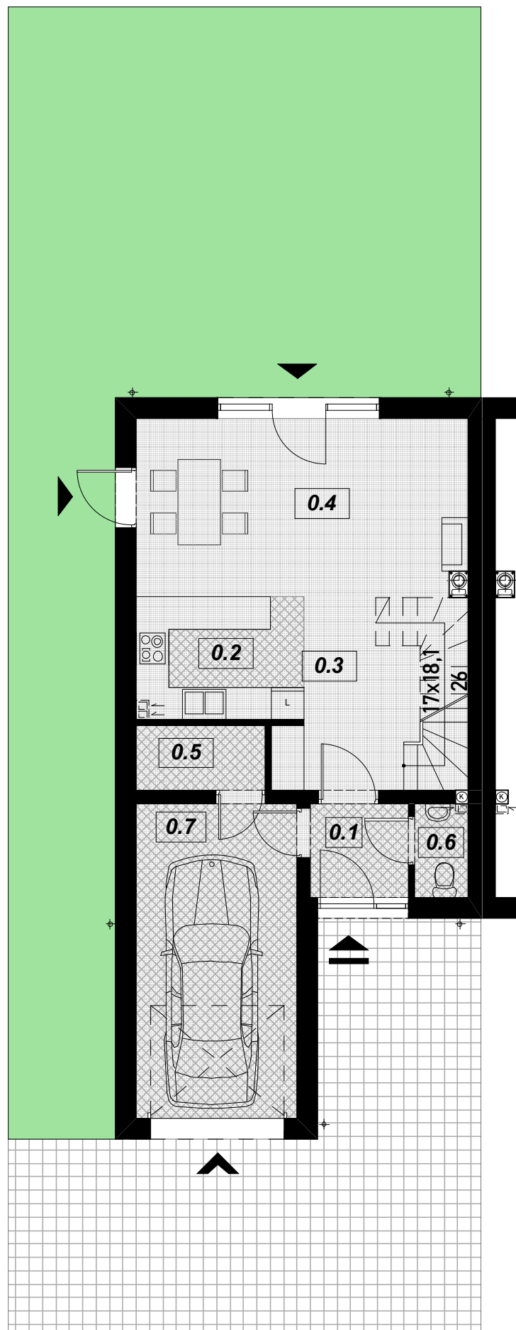
RZUT PARTERU SKALA 1:100