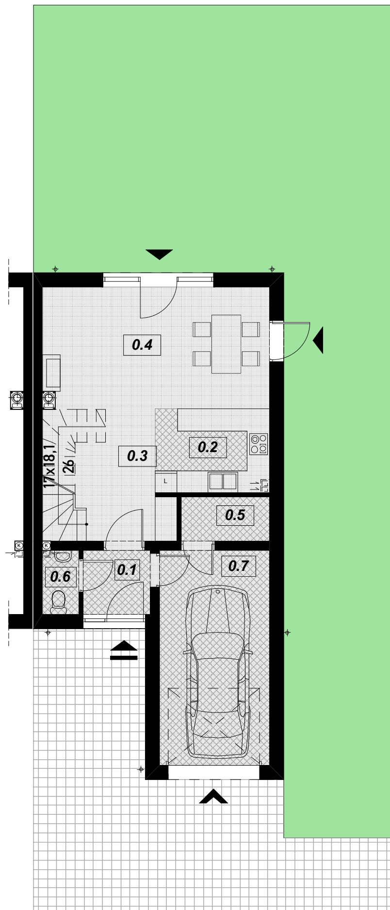
RZUT PARTERU SKALA 1:100